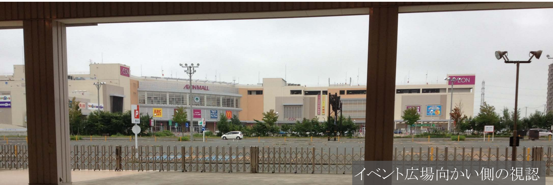
イベント広場向かい側の視認